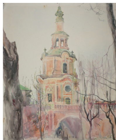
Рис. 13. Донской монастырь. 1976 г.