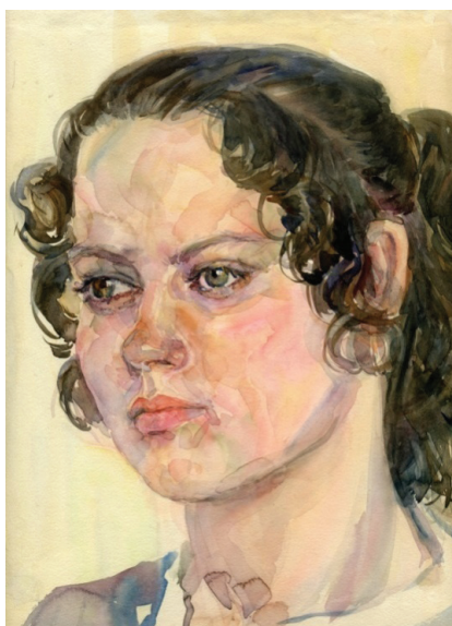
Рис. 9. Студентка. 1971 г.