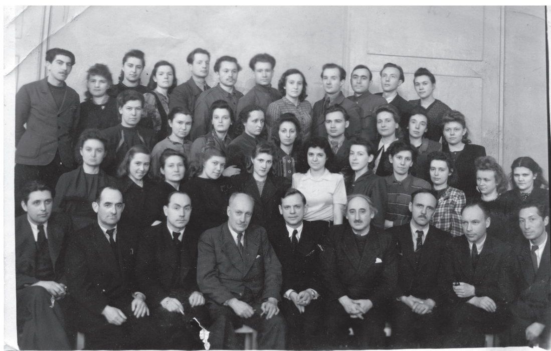
Рис. 5. Ленинград. ЛИСИ, выпуск архитектурного факультета 1948 г.

На обороте рукой художницы написан список: