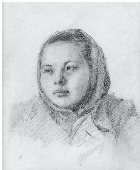
Рис. 7. Женщина в платке. 1951 г.

ков, трепещущих под весенним ветром на скалистых сопках, успевших на короткое время освободиться от снега (рис. 7). В такую весну 1952 г. родился ее первый сын — Александр.