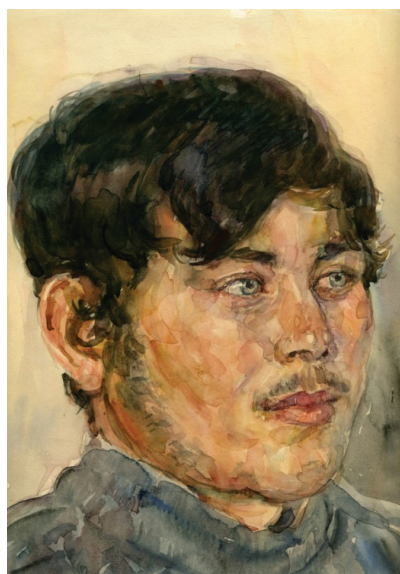
Рис. 8. Студент. 1971 г.