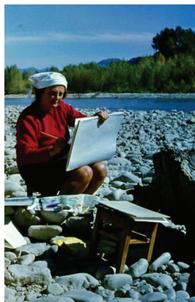
Рис. 17. Пленэр на реке Ульба. Казахстан, Усть-Каменогорск. 1970 г.