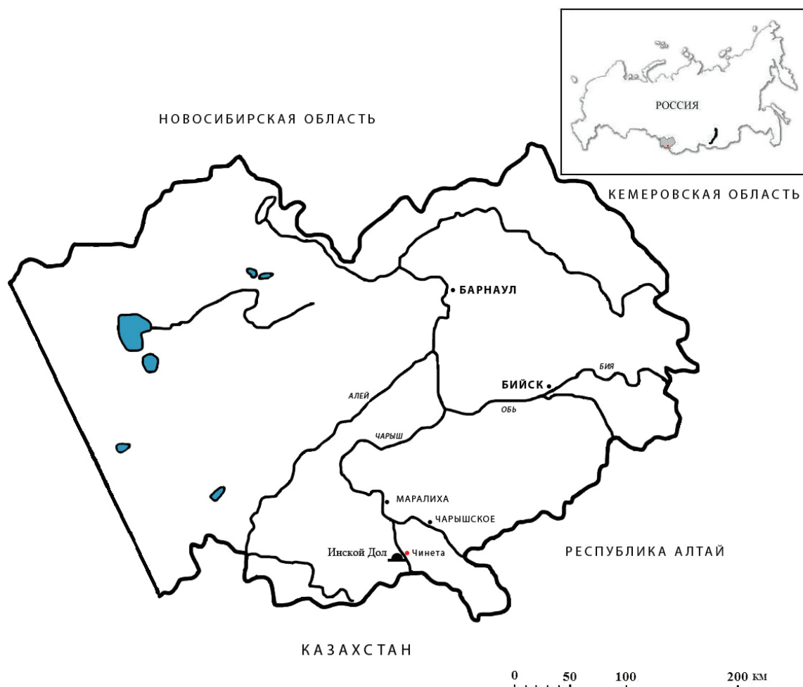
Рис. 1. Расположение могильника Инской дол

к юго-востоку от памятника находится фундамент от здания пионерского лагеря у края берега Иня. На некрополе выявлено две группы курганов. Первая группа из двух курганов располагалась в 20 м к западу от дороги, ведущей в направлении с. Чинета — с. Тигирек. Вторая группа из 15 курганов находится в 400 м к востоку от первой по обе стороны оврага, а также на небольшом елбане. Изучение топографии, планиграфии и конструктивных особенностей насыпей курганов позволило установить, что на могильнике Инской дол есть объекты скифо-сакского периода, результаты исследования которых частично опубликованы, а также курганы эпохи энеолита [1–3]. Характеристике результатов исследования курганов эпохи энеолита и посвящена данная публикация.