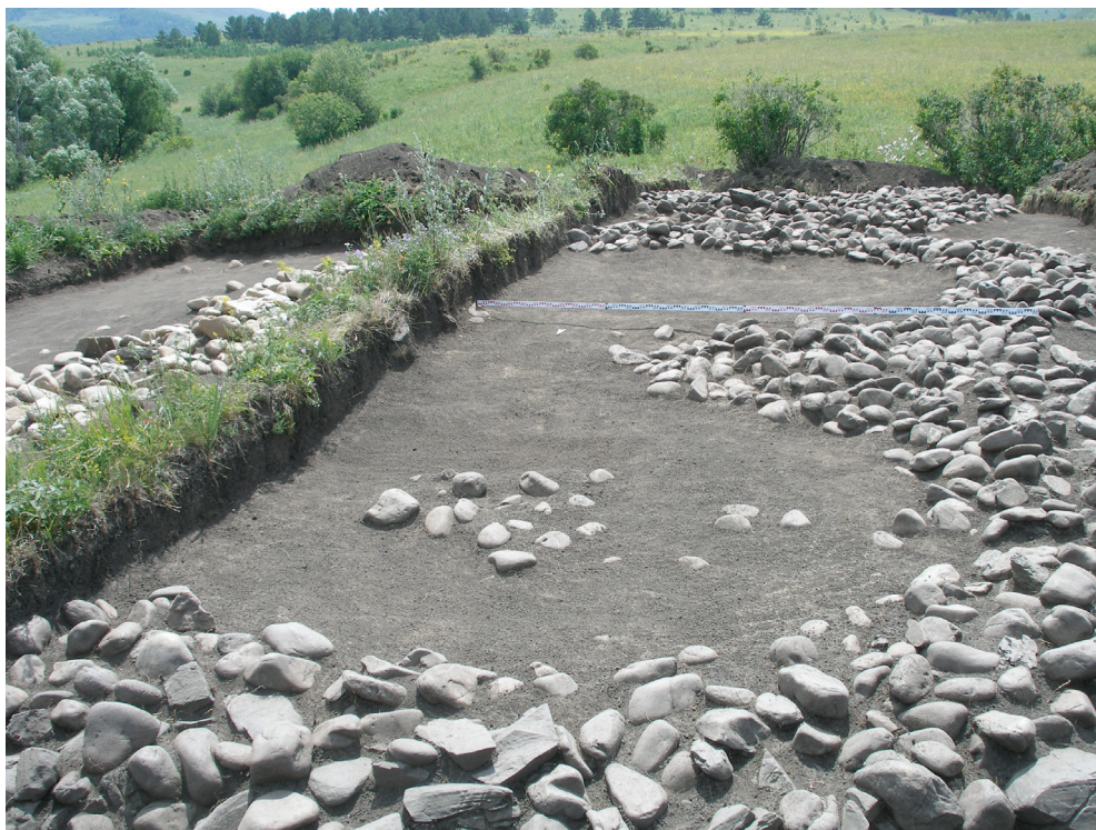
Рис. 5. Насыпи курганов 6–7

ной конструкции удалось выявить могильную яму, которая была ориентирована длинной осью с небольшими отклонениями по линии СВ-ЮЗ. Могильная яма имела следующие размеры от уровня древнего горизонта 2 \times 1,2 \times 0,94 м. В могиле выявлен скелет человека, который был уложен в вытянутом положении на спине с подогнутыми в сторону левого бока ногами и ориентирован головой на восток (рис. 6). Скелет был обильно посыпан красной охрой. Никаких предметов сопроводительного инвентаря не обнаружено.