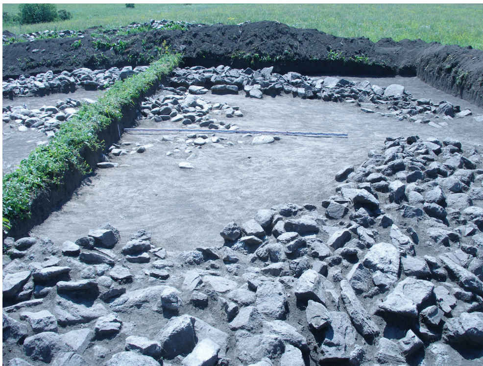
Рис. 3. Насыпь кургана № 5

ра данной прямоугольной конструкции была обнаружена могильная яма, которая ориентирована сторонами почти строго по направлениям горизонта. Могила имела следующие размеры: 2,3 \times 1,67 \times 0,72 м. В могиле обнаружен скелет человека, который был уложен на спину, вероятно, с подогнутыми ногами и ориентирован головой на запад (рис. 4). В 0,15 м к северу от черепа выявлен керамический орнаментированный сосуд яйцевидной формы (рис. 2. 3).