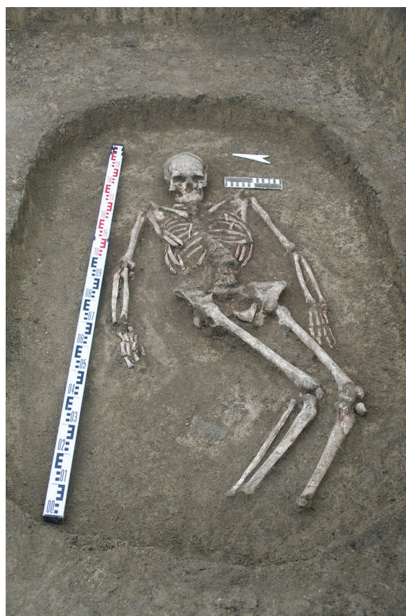
Рис. 6. Погребение в кургане № 6

Курган № 7 имел диаметр каменной насыпи, сложенной преимущественно в один слой также из мелких и средних камней, 7,5 м. Высота объекта составляла 0,35 м. Как и у предыдущего объекта, по периметру сооружения выявлено кольцо из небольших камней шириной 1,5–2 м. В центре кургана камни практически отсутствовали. После снятия каменного кольца была выявлена могильная яма, ориентированная длинной осью по линии СВ-ЮЗ. Могильная яма имела следующие размеры от уровня древнего горизонта: 1,54 \times 0,9 \times 0,79 м. В могиле обнаружено парное погребение умерших людей (см. рис. 7). Скелеты оказались не очень хорошей сохранности. Погребенные, вероятно, были уложены в вытянутом положении на спине с подогнутыми в левую сторону ногами, ориентированы головой на восток. В процессе зачистки скелетов были обнаружены остатки