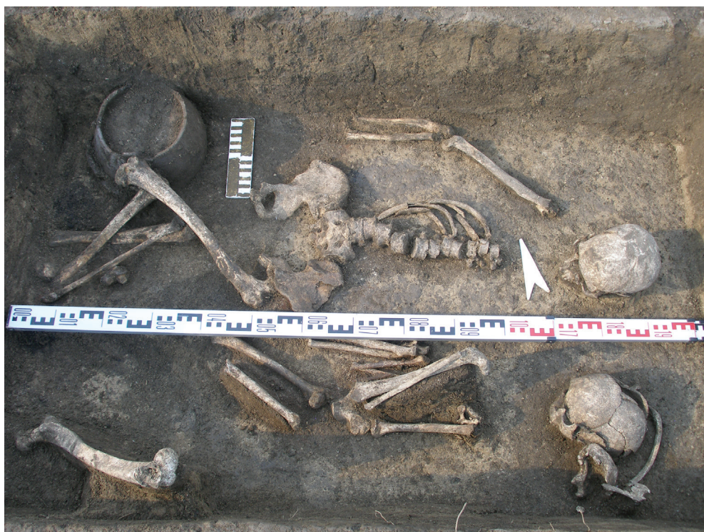
Рис. 7. Погребение в кургане № 7.

красной охры, которой посыпали тела умерших. В северо-западном углу могилы у ног первого скелета человека выявлен орнаментированный керамический сосуд плоскодонной формы (рис. 2. 4).