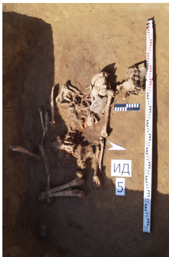
Рис. 4. Погребение в кургане № 5

Курганы № 6–7 располагались в 0,2 км к северо-востоку от курганов № 4–5 на отдельном небольшом елбане. До раскопок насыпи курганы фактически никак не выделялись на уровне современного горизонта. После зачистки насыпи курганов было установлено, что южная пола кургана № 6 и северная пола кургана № 7 перекрывают друг друга, образуя фактически единое сооружение (см. рис. 5). Диаметр каменной насыпи кургана № 6, сложенного преимущественного в один слой из камней, достигал 9 м. Высота объекта составляла 0,35 м. При этом внешне курган представлял собой каменное кольцо шириной 1,5–2 м из мелких и средних камней. В центральной части кургана камни фактически отсутствовали. При разборе каменного кольца в северо-западной его части был обнаружен неорнаментированный фрагмент керамики. После полного снятия камен-