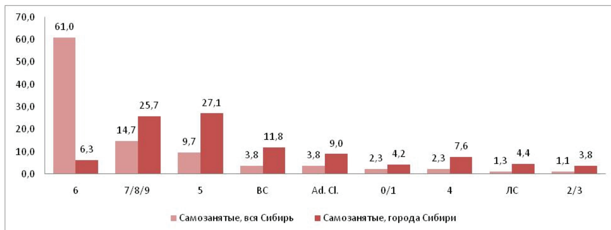
Рис. 1. Соотношение занятого населения Сибири по группам HISCO

* Группы HISCO: 0/1. Квалифицированные специалисты и работники интеллектуального труда (группы 3–12, 36, 63); 2/3 Административные, управление и конторские служащие (группы 1, 2, 45); 4. Работники сферы торговли (группы 46–59); 5. Работники сферы обслуживания (группы 13, 60–62, 64); ВС — Вооруженные силы (группа 4); 6. Работники сельского хозяйства, животноводства, лесных промыслов, охотники и рыболовы (группы 17–21); 7/8/9 Работники сферы производства, транспорта, неквалифицированные рабочие (группы 22–37, 38–44); Ad. Cl. (Additional Classification) — Группы дополнительной классификации (группы 14,15,65); ЛС — Лишенные свободы (группа 16).