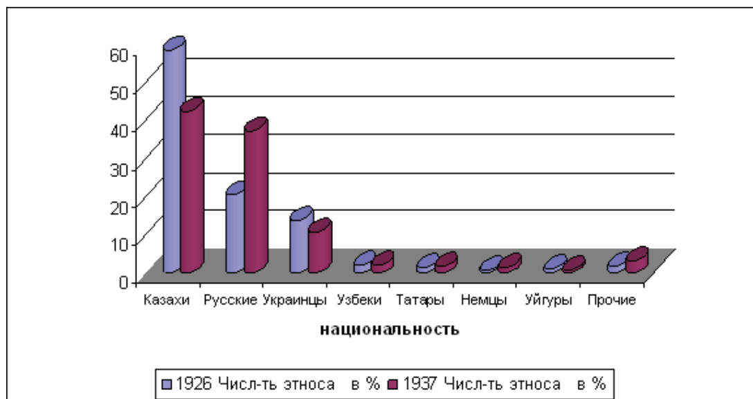
Рис. 1. Численность населения Казахстана по национальному составу по данным переписей 1926 и 1937 гг.

ки оставалось, как и в 1926 г., полиэтничным. 37,4% населения Казахстана составляли русские, 42,6% казахи, 10,7% украинцы, кроме того, были представлены немцы, корейцы, уйгуры, поляки (рис. 1).