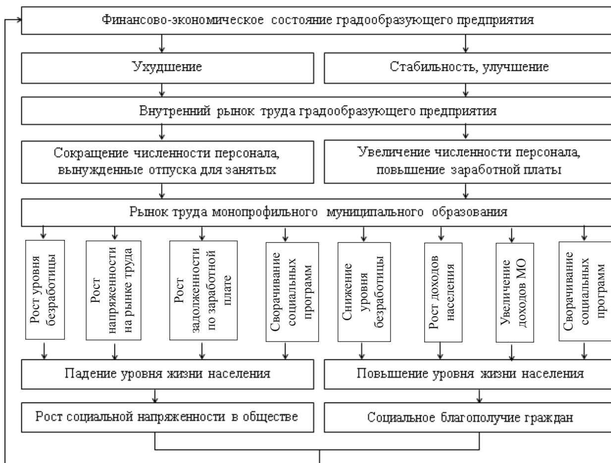
Рис. 3. Влияние градообразующего предприятия на рынок труда монопрофильного муниципального образования

Влияние финансово-экономического состояния градообразующего предприятия на локальный (местный) рынок труда моногорода показано на рисунке 3.