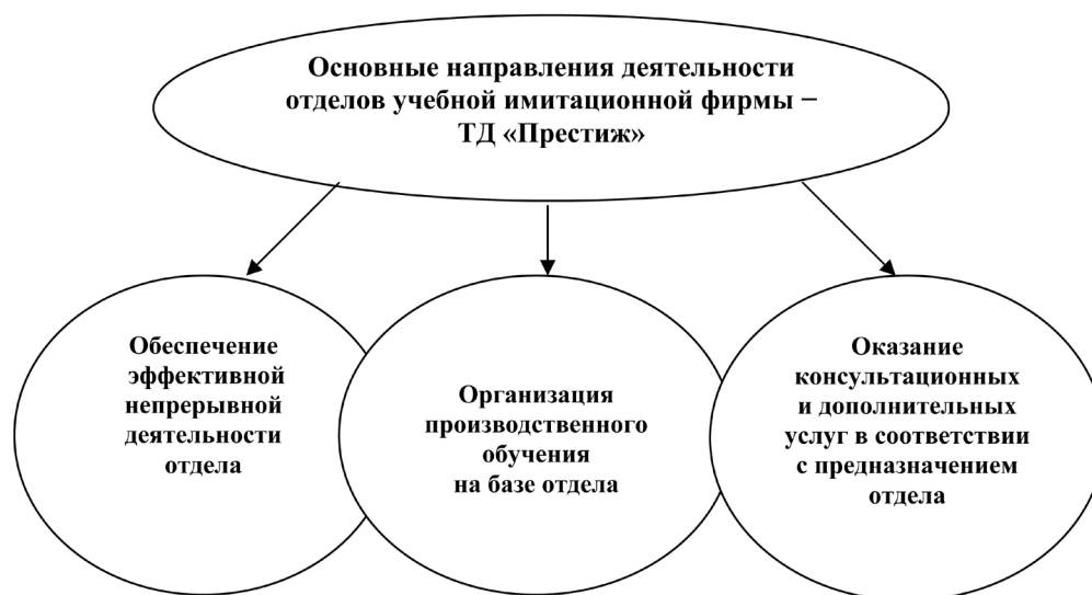
Рис. 2. Основные направления деятельности отделов учебной имитационной фирмы