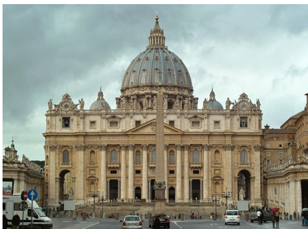
Рис. 2. Собор Святого Петра в Риме

композиция «Пьета» собора Санта-Мария дель Фьоре 1498–1499; роспись потолка Сикстинской капеллы в Ватикане, 1508–1512 [5]. Архитектурные работы Микеланджело – ансамбль площади Капитолия и купол Ватиканского собора в Риме. Во флорентийской церкви Сан-Лоренцо Микеланджело создал внутреннее оформление так называемой новой сакристии с саркофагами Лоренцо и Джулиано Медичи. В архитектуре Италии второй половины XVI в. он обусловил маньеризм – произвольное смешение элементов различных ордеров и стилей. Примером является великолепный декор Дворца дождей и Золотой лестницы. Стены дворца расписаны фресками великого Веронезе.