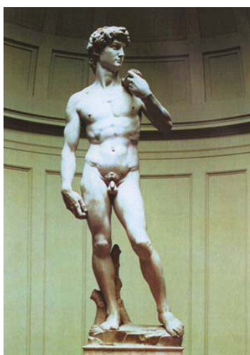
Рис. 3. Микеланджело. Давид

и зодчества были созданы Высшие художественно-технические мастерские – ВХУТЕМАС (рис. 4). В 1926 г. ВХУТЕМАС был реорганизован в Высший художественно-технический институт (ВХУТЕИИ), основным принципом которого являлось соединение художественного и технического обучения будущих архитекторов (рис. 5). На архитектурном факультете велась специализация по различным видам сооружений: жилых, общественных, промышленных, по планировке городов и по декоративно-пространственной архитектуре. В 1930 г. архитектурный факультет ВХУТЕИИ был объединен с факультетом Московского высшего техни-