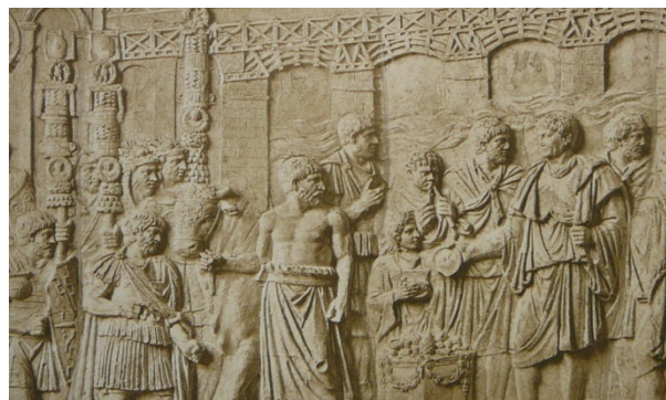
Рис. 1. Аполлодор. Изображение моста на колонне Траяна в Риме

периода, архитектурное образование получает новое качественное развитие, появляются универсальные специалисты: выдающиеся архитекторы, художники, скульпторы, живописцы, ювелиры, декораторы. Донато Браманте – основоположник и крупнейший представитель архитектуры Высокого Возрождения. Его самой известной работой является главный храм западного христианства – базилика Святого Петра в Ватикане. Донато Браманте начинал как живописец. В своем творчестве испытал влияние художников Пьеро делла Франческо, Лучано Лаураны, Леонардо да Винчи. Леон Баттиста Альберти – еще один яркий представитель своего времени – был архитектором, скульптором, художником, писателем, математиком, автором ряда научных трактатов об искусстве: «О зодчестве», «О статуе». В «Десяти книгах о зодчестве» он характеризует архитектора как универсального мастера. Для подготовки будущего зодчего отдавали для обучения к определенному мастеру, под руководством которого он изучал архитектурное и художественное искусство, классические памятники, архитектурные ордера, стройматериалы, овладевал способами их обработки, знаниями в области математики. После ученичества у мастера архитекторы совершенствовали свое архитектурное и художественное образование исполнением самостоятельных заказов, открывая уже собственные мастерские [5].