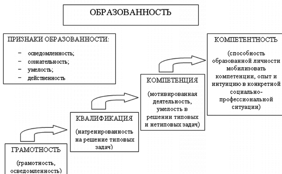
Рис. 2. Представление понятия «образованность»

«квалификация», нейтрального в нравственно-этическом отношении, термин «компетентность» подразумевает способность оплачиваемого работника принимать ответственные решения и действовать адекватно требованиям его общественного и служебного долга. В этом смысле «компетентность», будучи социальным феноменом, понимается как личностное качество субъекта специализированной деятельности (например инженера, педагога, врача) в системе социального и технологического разделения труда. В смысловом поле компетентность соотносится с понятиями «осведомленность», «эрудированность», «усвоенность социального опыта», намеренность этот опыт применить и обосновать свою позицию (выбор) (рис. 2).