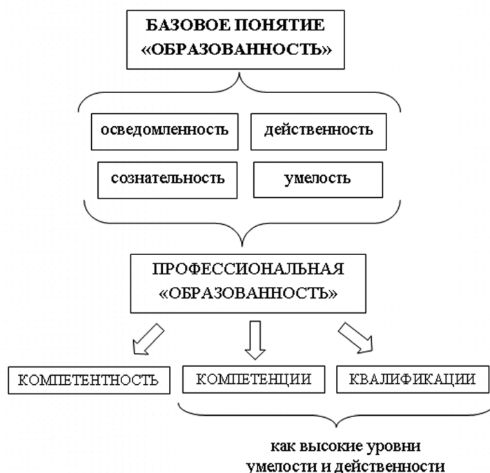
Рис. 3. Взаимозависимость образованности, квалификации, компетентности и компетенций