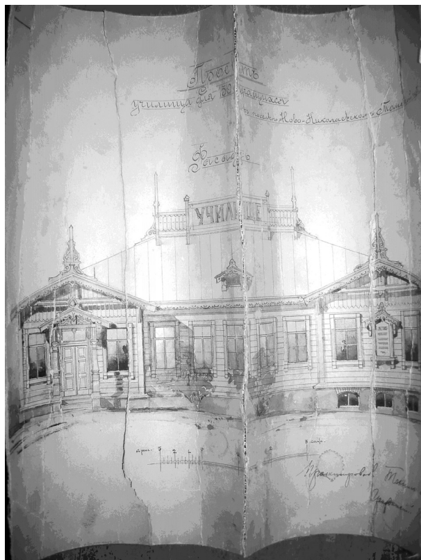
Рис. 2. Проект училища в пос. Новониколаевске, 1915 г.

алтайским краеведом Г.Д. Няшиным баллотировался в гласные Барнаульской Думы. Члены общества сделали много для просвещения народа, создавая бесплатные библиотеки и школы для простых людей.