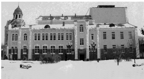
Рис. 3. Бийский драматический театр, 2009 г.

В конце 1913 г. в Петербурге было организовано Русское общество городов-садов, основная задача которого состояла в полной реформе домо- и градостроительства на основе рационального городского и пригородного расселения. У истоков развития идеи города-сада в России стоял архитектор, теоретик градостроительства Д.А. Лебедев, который в 1894–1895 гг. разрабатывал градостроительные принципы, во многом тождественные с концепцией городов-садов [4, с. 33]. Отдел общества функционировал в Барнауле. Председателем Барнаульского общества городов-садов был А.М. Ларионов, управляющий Алтайской железной дорогой, членами общества состояли краевед Г.Д. Няшин, городской архитектор И.Ф. Носович и ряд других общественных деятелей Барнаула. В первой трети XX в. Барнаул был преимущественно деревянным городом, исключение составлял его исторический центр: сереброплавильный завод, Демидовская площадь, улица Петропавловская (ныне – Ползунова), купеческая застройка (в районе Старого базара) [4, с. 38].