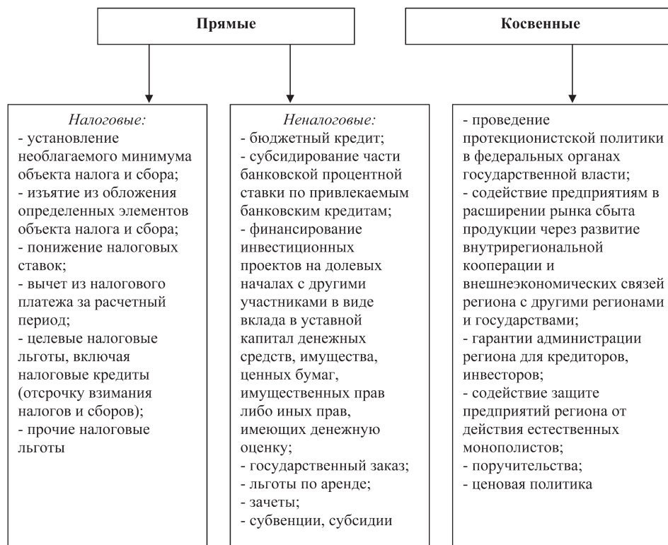
Рис. 2. Система мер стимулирования развития экономики территориальных образований, используемых региональными органами власти

роста. В противном случае отдельные территориальные общности могут стать вечными «содержанцами» регионального бюджета.