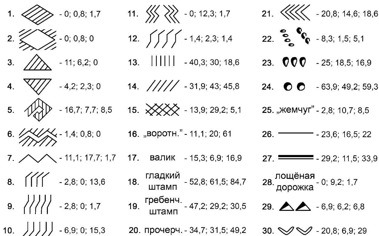
Рис. 2. Статистическая характеристика орнаментации сузгунской керамики поселений Алексеевка I, XXI и городища Алексеевка XIX, %

вым памятникам Среднего Прииртышья и находит полные аналогии в известных пахомовских и сузгунских комплексах на этой территории.