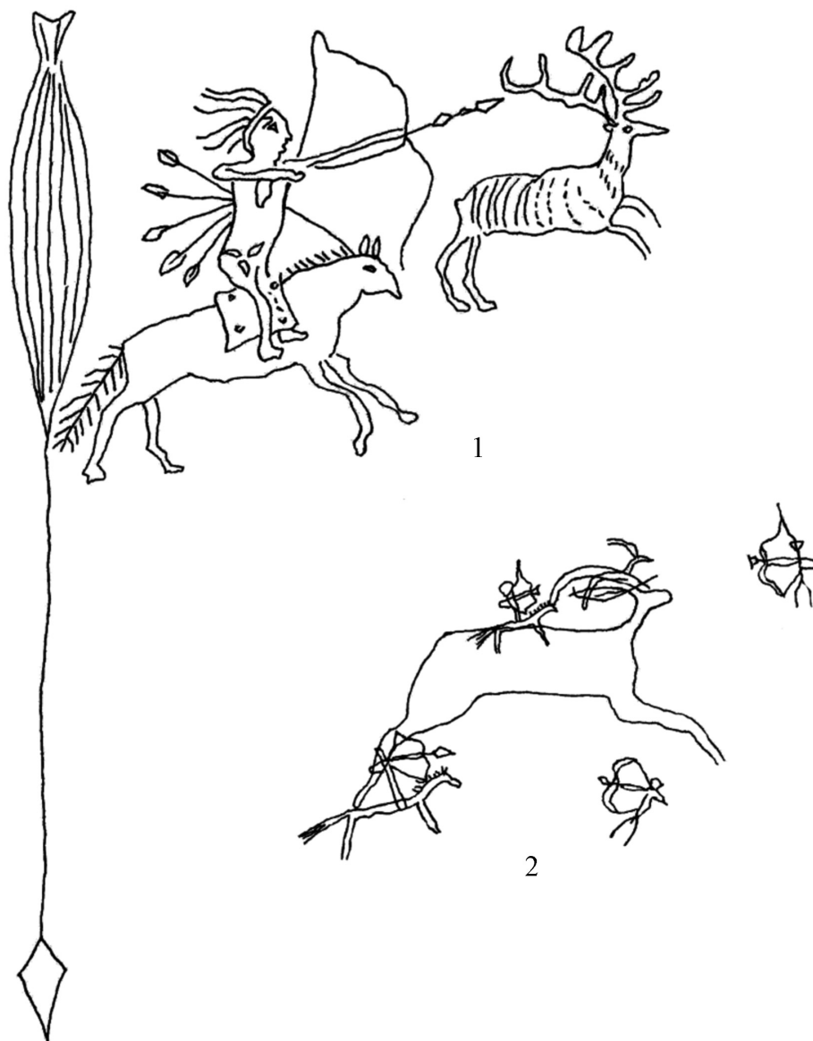
Рис. 2. Графические композиции охоты: 1 – Бичикту-Бом (по Чорос-Гуркину, 1915); 2 – Жалтыз-Тобэ (по Кубареву, 2004)

На другой накладке для лука из того же могильника (рис. 1 – 4) изображена жанровая сценка игры собак. Животные смотрят друг на друга (т.е. они взаимосвязаны). Характерно изображение тела с помощью двух параллельных линий, переходящих в ноги. Морды вытянутые, тупые. У одной из собак хвост игриво загнут вверх. По мнению А.А. Тишкина, данные находки датируются II–IV вв. н.э. [3, с. 488–493] и стилистически соотносятся с наскальными изображениями хуннского времени Горного Алтая (рис. 2 – 2; 3 – 2, 3, 4, 5, 6, 7).