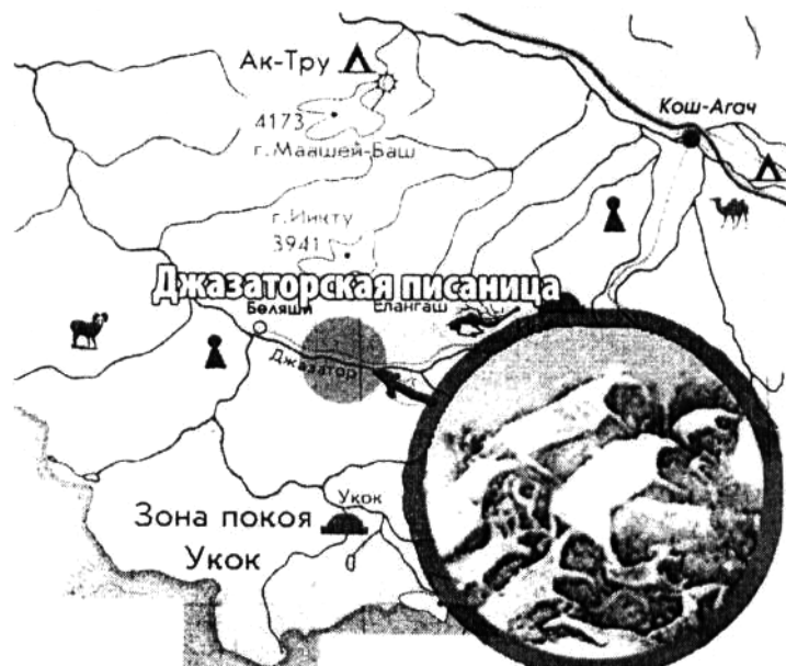
Рис. 1. Месторасположение джазаторского камня